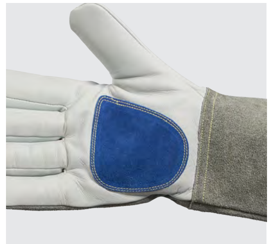
blaues Spaltleder zur Verstärkung an den Handflächen und Daumen

Schau Dir die Größentabelle und Erklärung auf Seite 9 an.